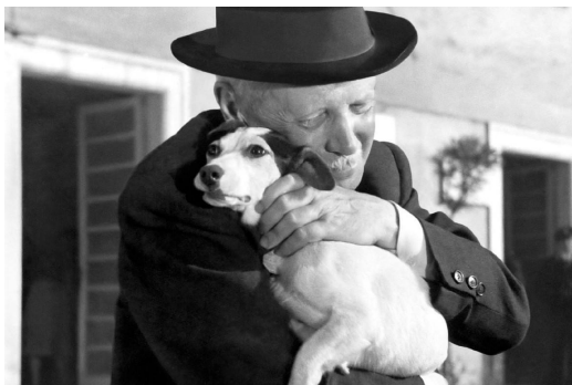
Figura 2 — Umberto D. (Vittorio De Sica, 1952).