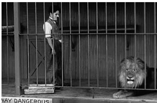
Figura 3 — O Circo (Charles Chaplin, 1928).