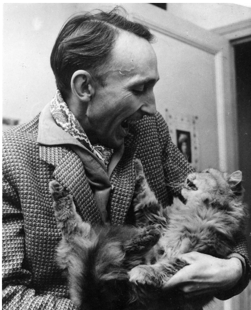
Figura 1 — André Bazin e gato.