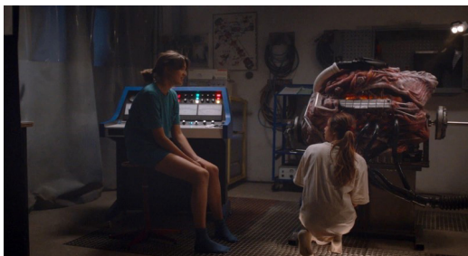
Figura 4 — A Máquina de Alex (2023), dirigido por Maël Le Mée.

Como estabelecido, a conexão intrínseca do cinema com o corpo permeia a construção deste elemento artístico. A obra de David Cronenberg exerceu notável influência sobre outros cineastas, como ilustrado no curta-metragem A Máquina de Alex (2023), dirigido por Maël Le Mée (Figura 4). O filme explora um universo onde os carros são seres vivos, com órgãos no lugar de seus motores e engrenagens e, portanto, os mecânicos se tornam médicos que operam nessas máquinas orgânicas. A concepção da obra, alinhada a diversos outros exemplos presentes na história do body horror , dialoga com a proposta teórica de André Bazin e Donna Haraway, ao vislumbrar a possibilidade de um cinema não-antropocêntrico. Podemos dizer: um transcinema trans:humanista. Nessa perspectiva, a narrativa propõe um universo no qual os humanos coexistem em igualdade com outras formas de vida, transcendendo as barreiras tradicionais entre o humano e o não-humano.